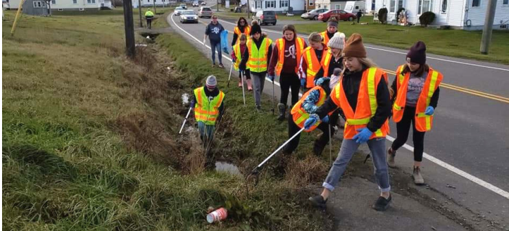
Les membres de l'équipe féminine de hockey Western Riptide ont été l'un des 7 groupes de bénévoles qui ont participé au programme communautaire de nettoyage des déchets 2020.

Merci à tous nos bénévoles qui ont participé au programme communautaire de ramassage de déchets. Cet automne, 7 groupes ont nettoyé 29 km de chemins et une plage. Un total de 1,09 tonne (2 401 lb) de déchets ont été ramassés à Clare, l'équivalent de 2 ours polaires, 150 boules de quilles ou 364 manteaux d'hiver !